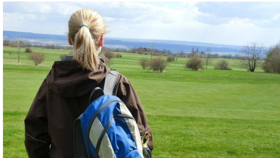
Vom Golfplatz hat man einen herrlichen Blick auf Schöningen