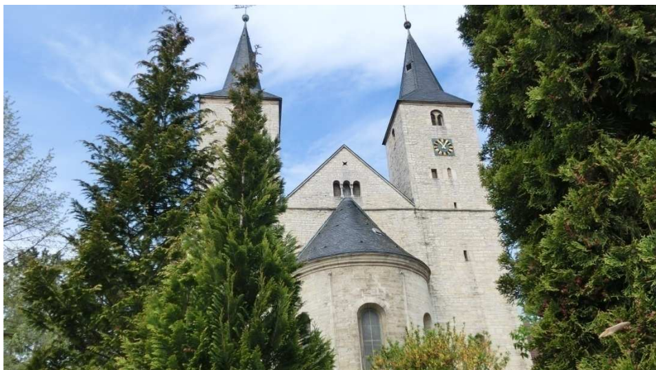
Vorbei an der Lorenzkirche geht es in den Elm