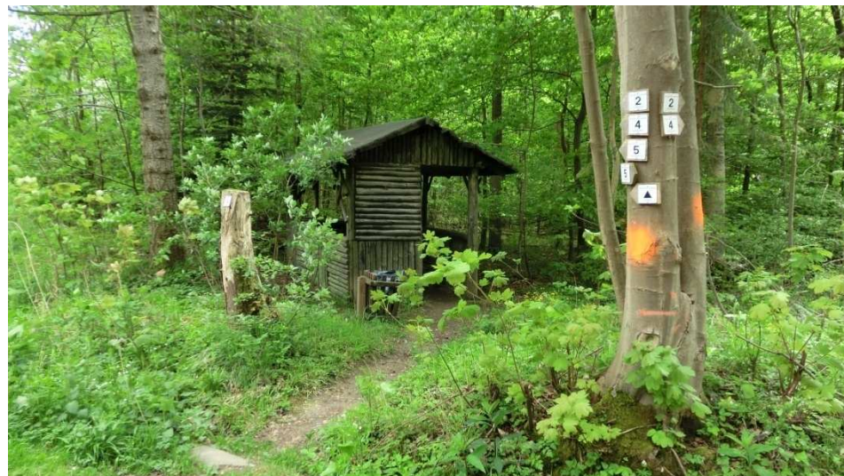
Schutzhütte am Bärensohl