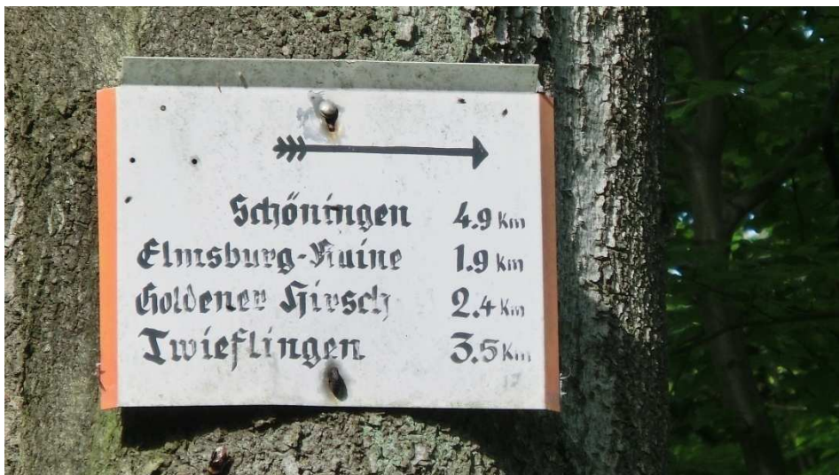
Alter Wegweiser auf dem Kammweg