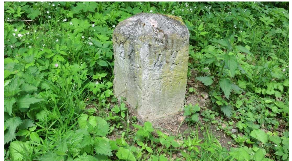
Der 5-kantige Stein