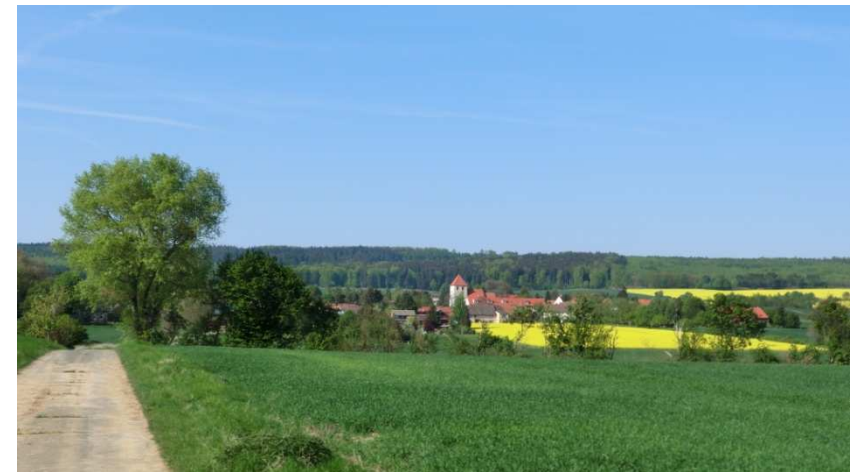
Blick von Süden auf Ampleben und den Elm