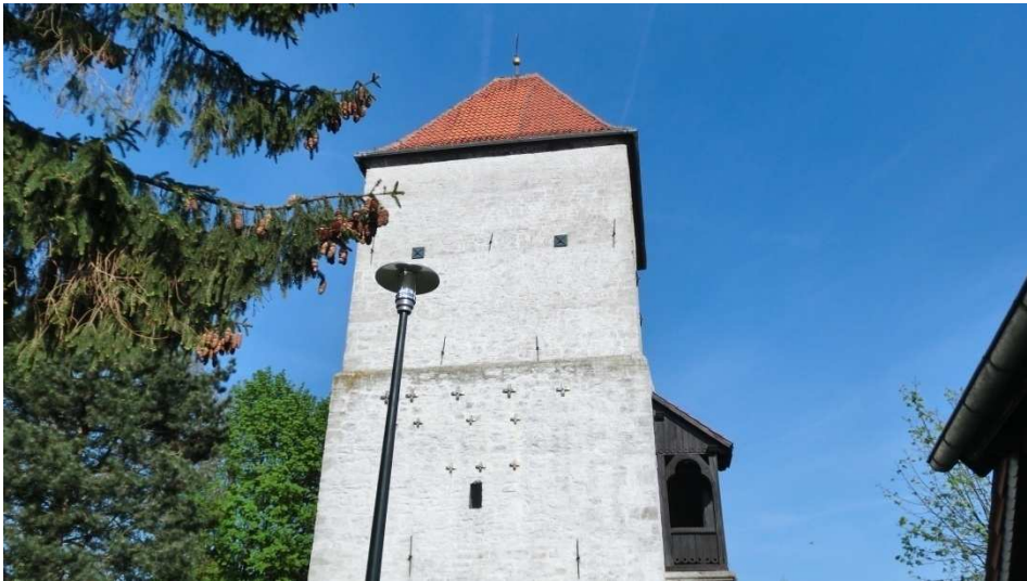
Die Kirche in Ampleben