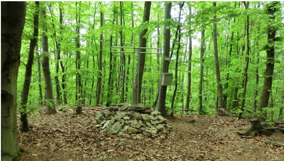
Das Eilumer Horn