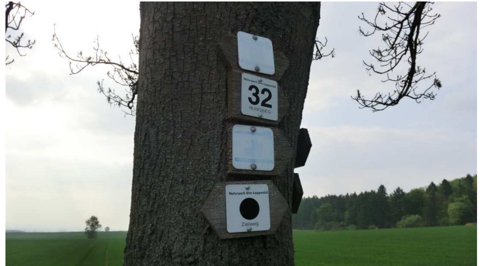
Wegmarkierung an der Straße zum Elm (Ampleber Berg)