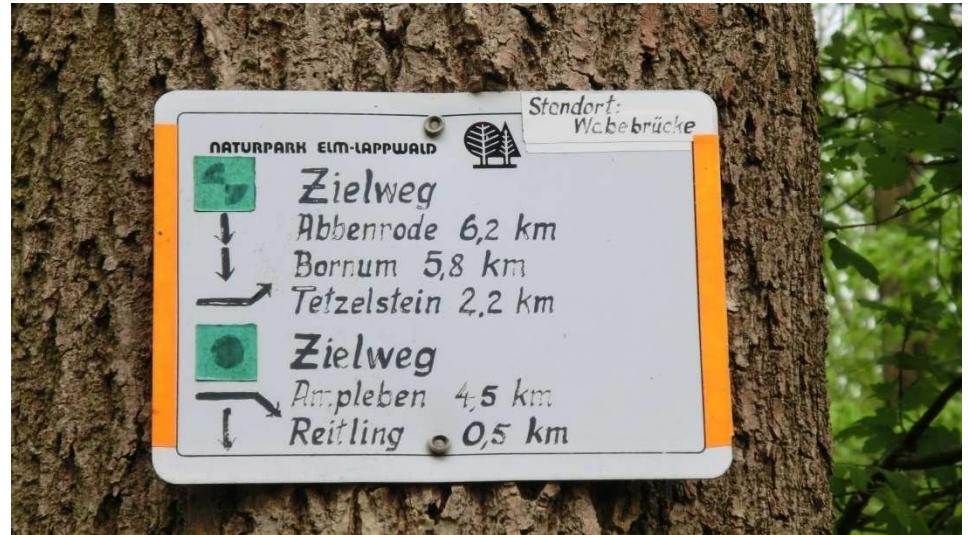
Wegweiser kurz vor dem Ziel