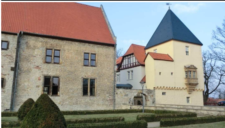
Start der Wanderung ist auf dem Burgplatz am Schloss