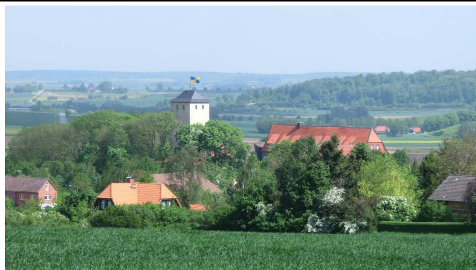
Blick auf Warberg