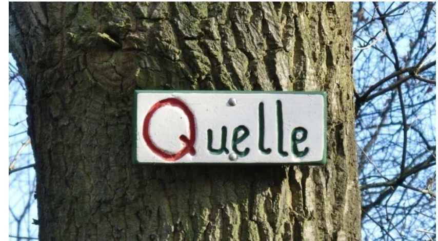
An der Schunterquelle