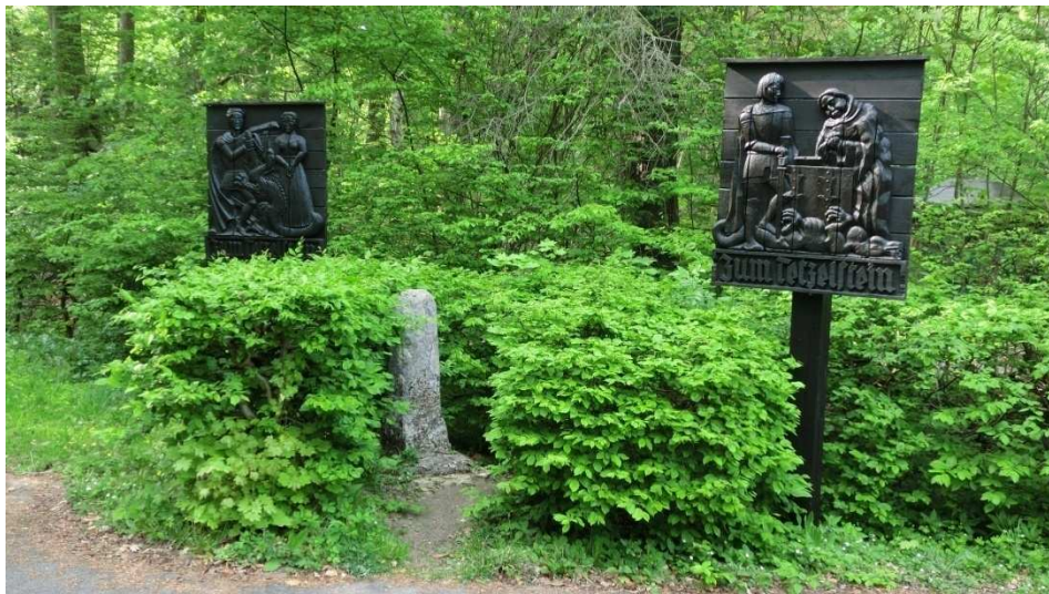
Start der Wanderung ist am Tetzelsstein