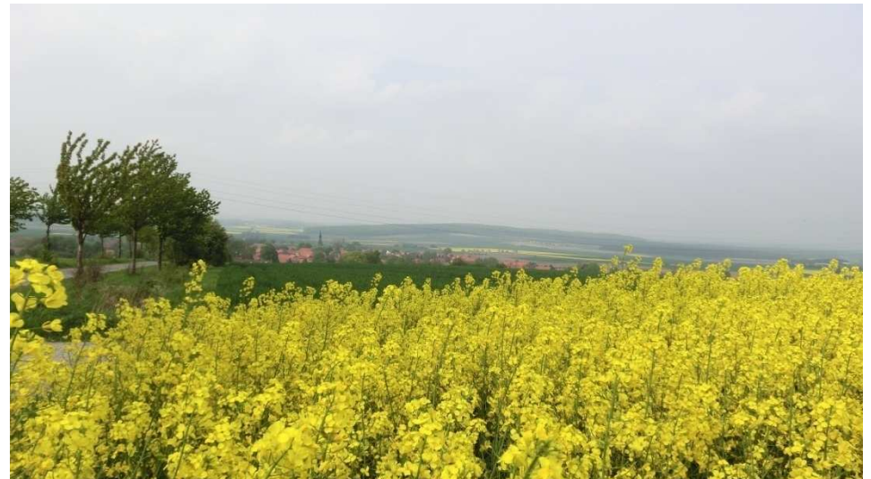
Blick auf Bornum