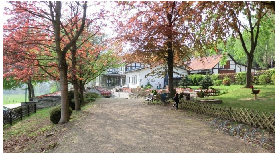
Am Ausflugslokal im Reitling