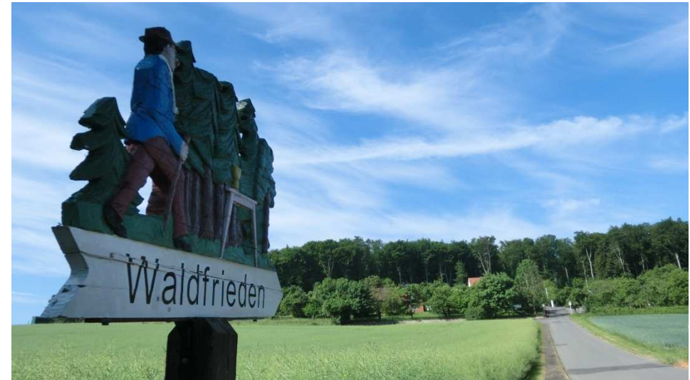
Blick zum Waldfrieden

http://www.elm-freizeit.de/ http://www.schoeningen.de