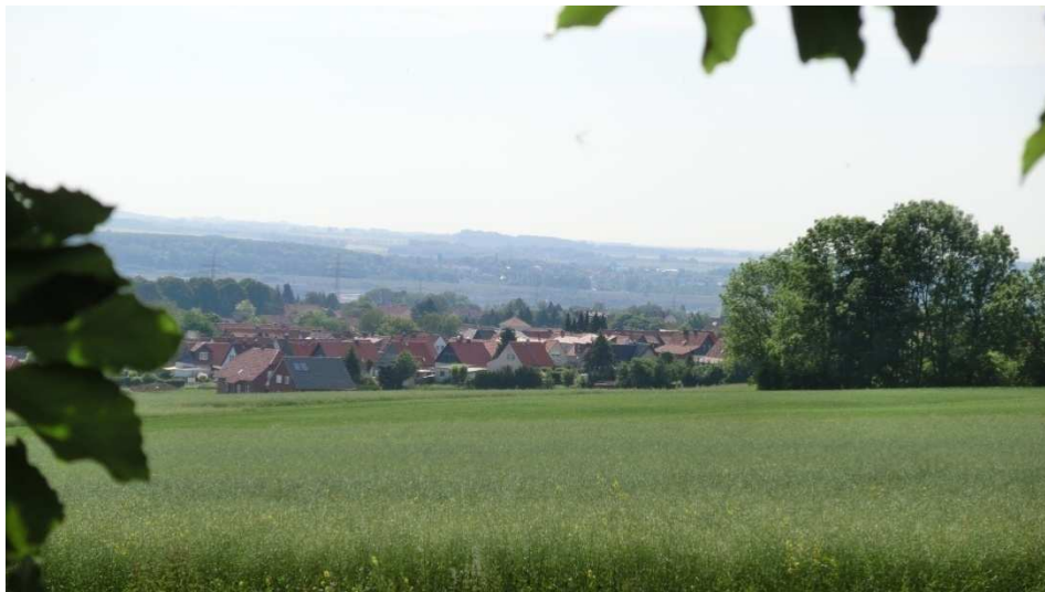
Blick auf Schöningen