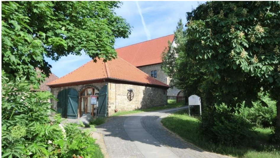
Start der Wanderung ist auf dem Burgplatz am Schloss