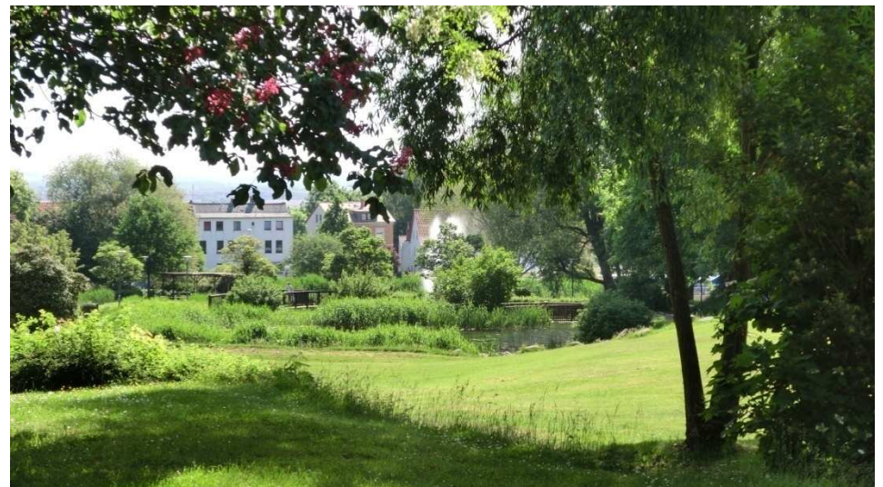
Die Bürgermeisterwiese in Schöningen