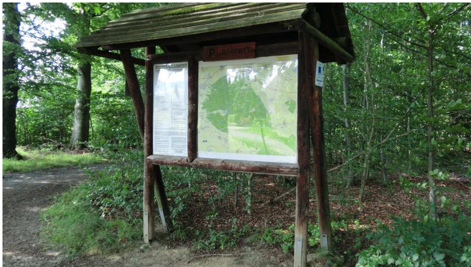
Start der Wanderung ist an der Infotafel am Borrwege