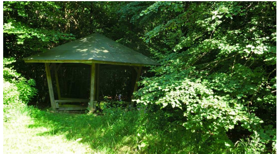
Schutzhütte am Eilumer Horn