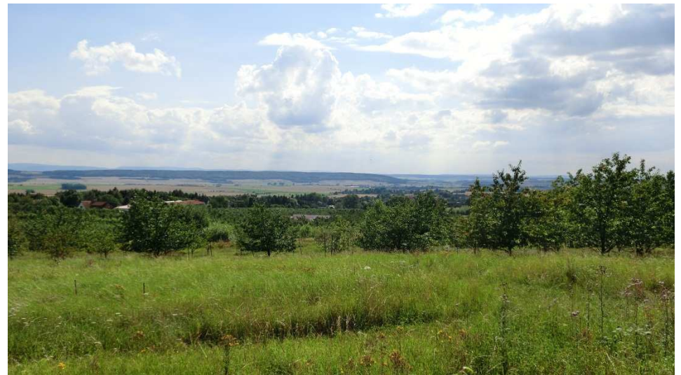
Blick über die Obstwiesen in Richtung Asse