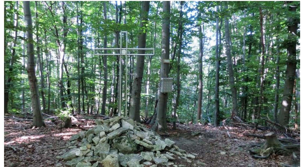
Gipfelkreuz auf dem Eilumer Horn