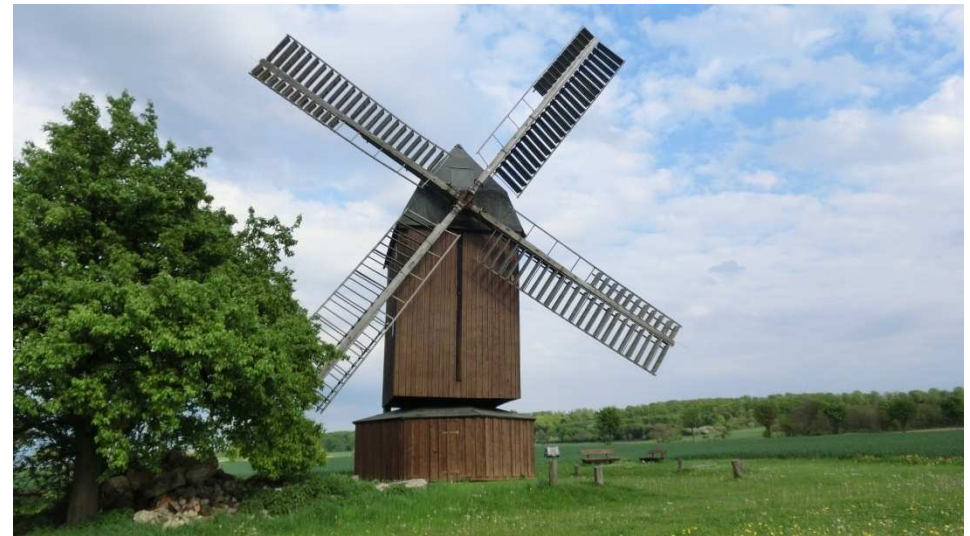
Die Windmühle in Abbenrode