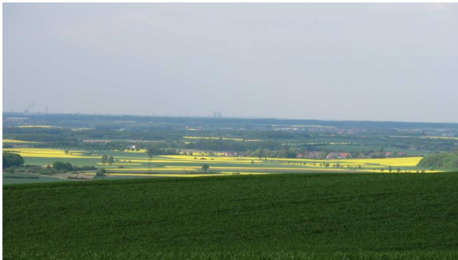
Blick vom Elmrand in Richtung Wolfsburg