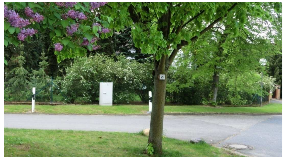
Im Ort geht es gleich links hinauf in den Elm