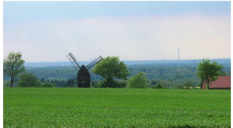
Blick auf die Windmühle, im Hintergrund ist Braunschweig