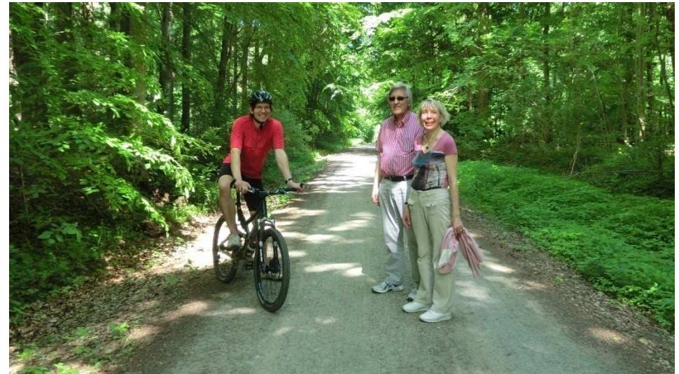
Begegnungen auf dem Bornumer-Rundweg