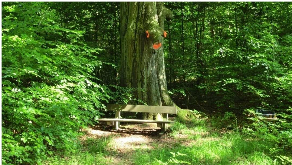
Im Sprachgebrauch wird er Arborrex (Baumkönig) genannt