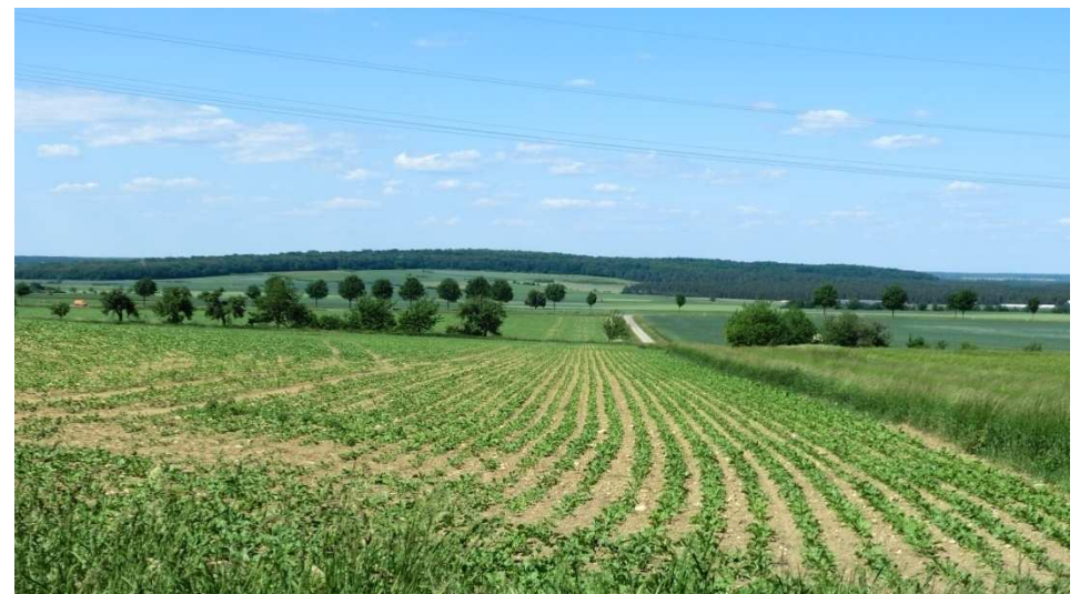
Pfad zu Breite Berg