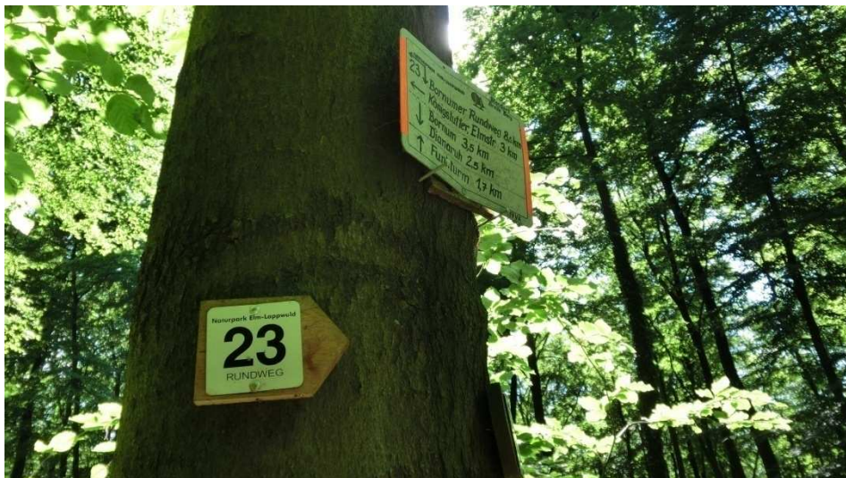
Pfad zu Breite Berg