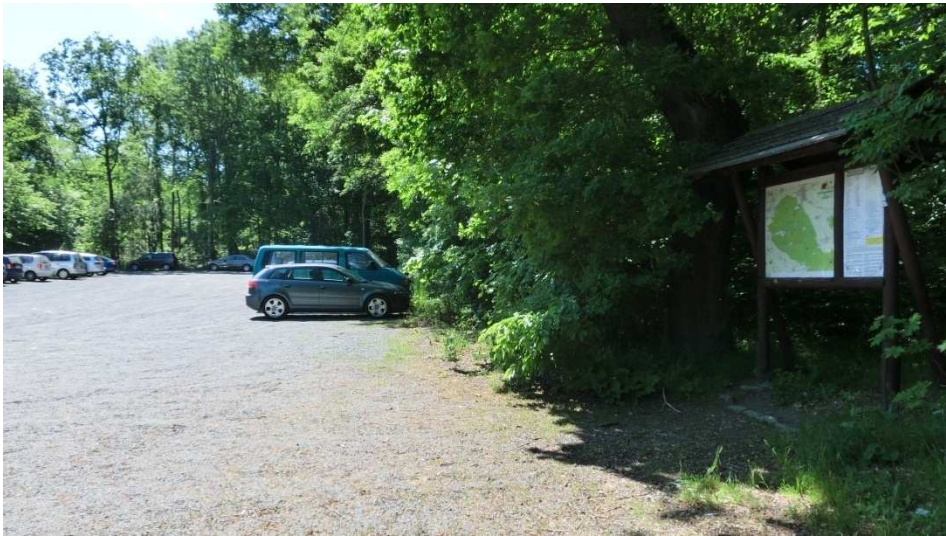
Start der Wanderung ist auf dem Parkplatz in Langeleben