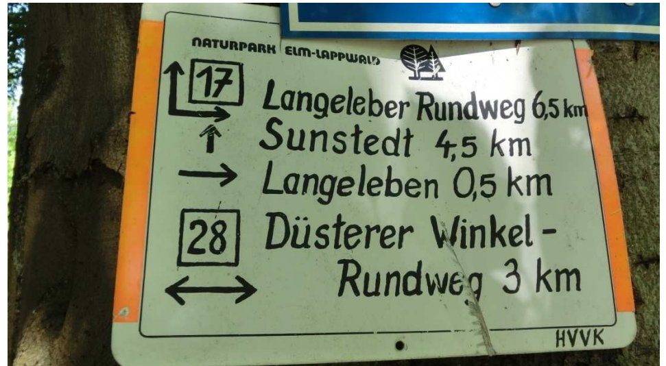
Wegweiser auf dem Parkplatz Düsterer Winkel