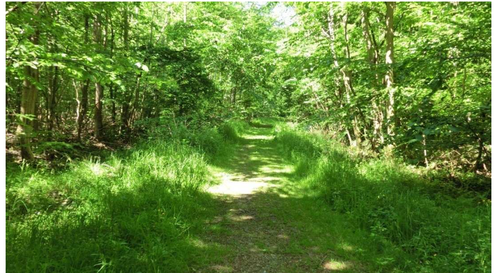
Weg in Richtung Sunstedt