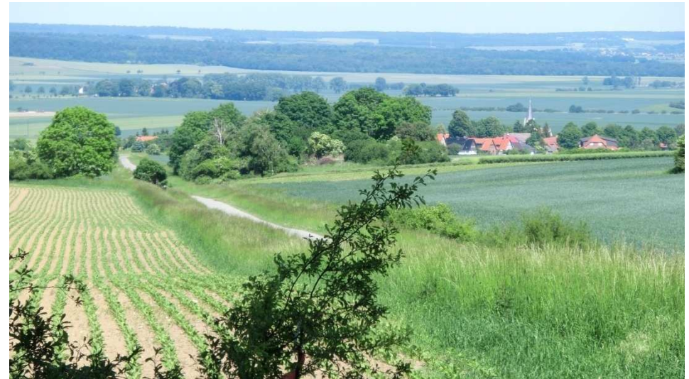
Blick vom Waldrand auf Sunstedt