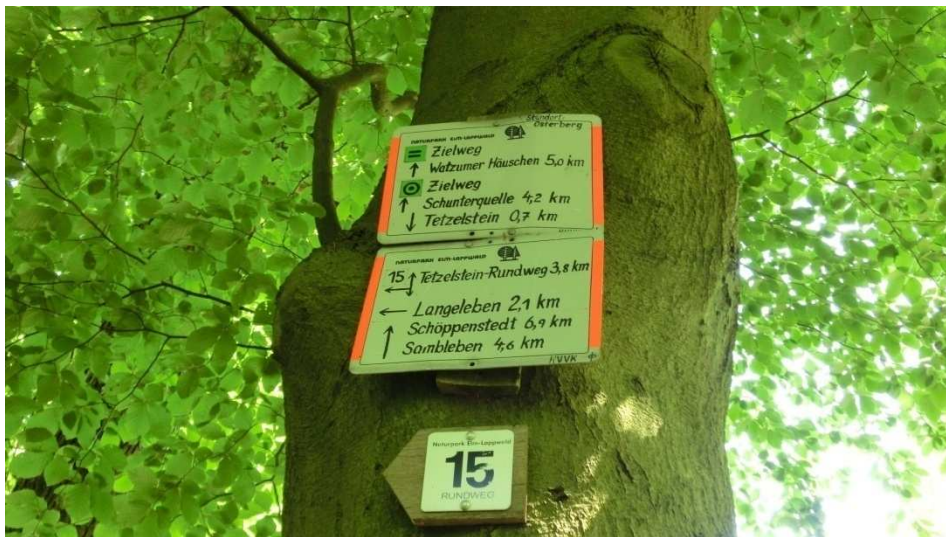
Begegnungen auf dem Tetzelsstein-Rundweg