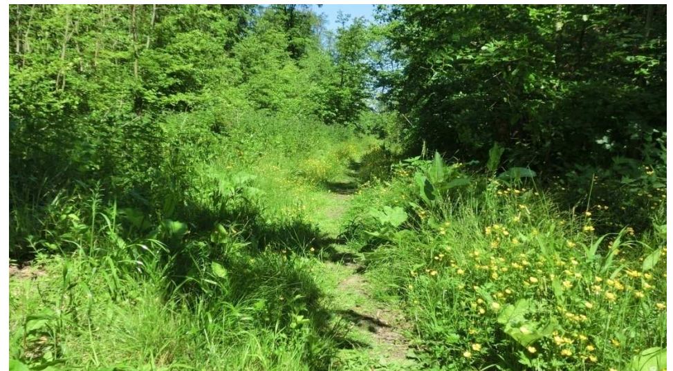
Der RW15 ist sehr naturbelassen