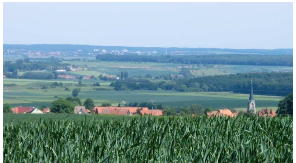
Blick auf Lelm