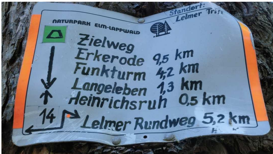
An der Lelmer Trift