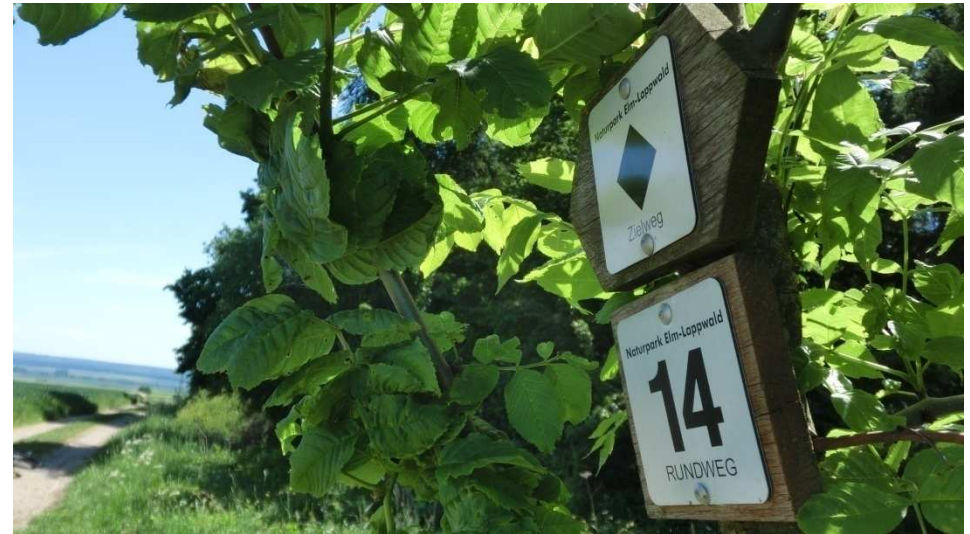
Am Waldrand zurück zum Ausgangspunkt der Wanderung