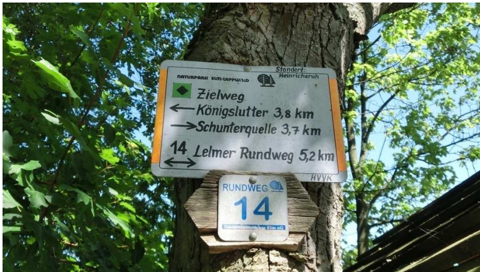
Gipfelkreuz am Eilumer Horn