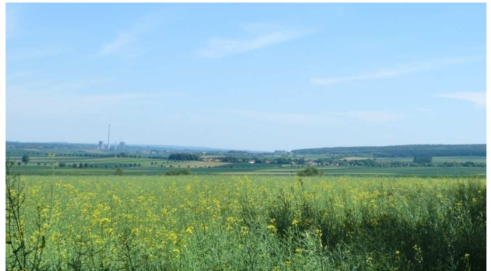
Blick in Richtung Rábke