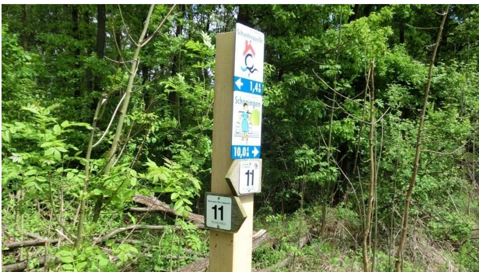
Vom Schunterquellenweg geht es rechts ab