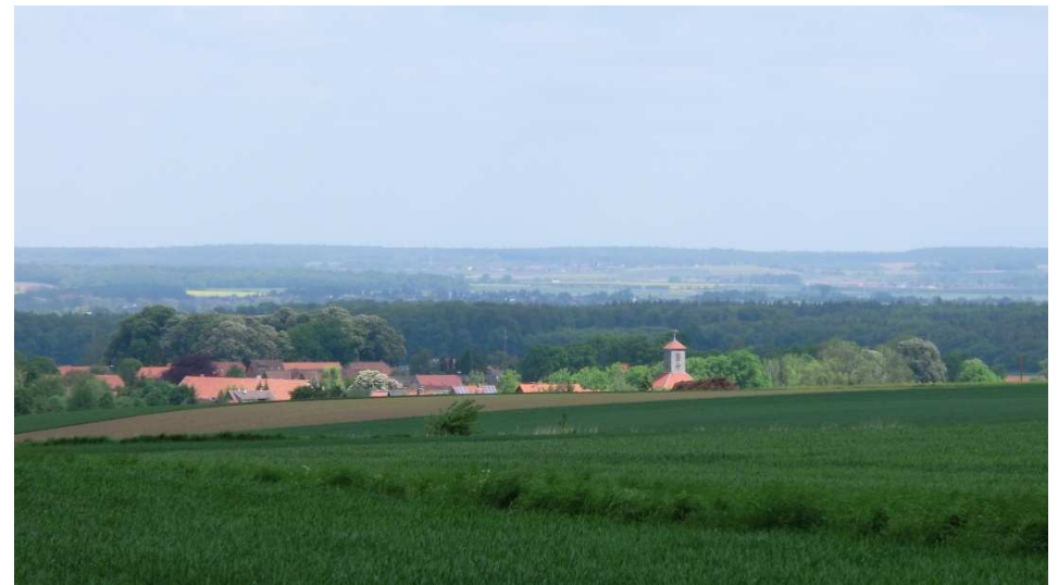
Blick vom Bierweg auf Lelm