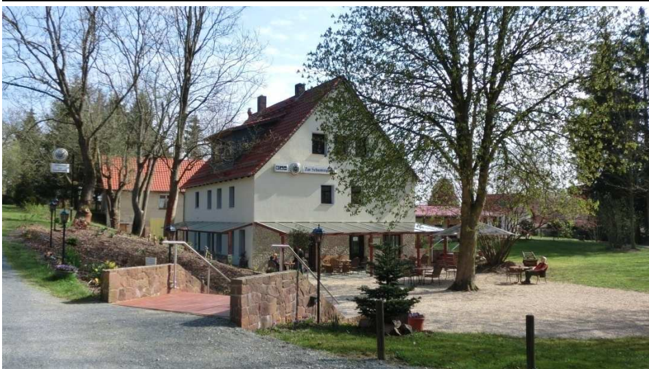
Start der Wanderung ist am Ausflugslokal Zur Schunterquelle