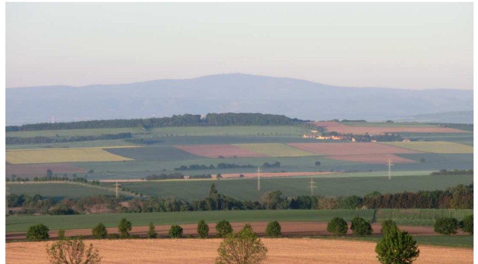
Blick auf Heeseberg und Brocken in der Morgendämmerung