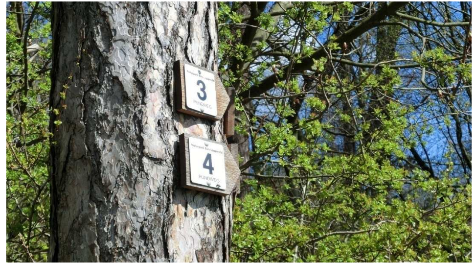
Auf dem Rundwanderweg 4