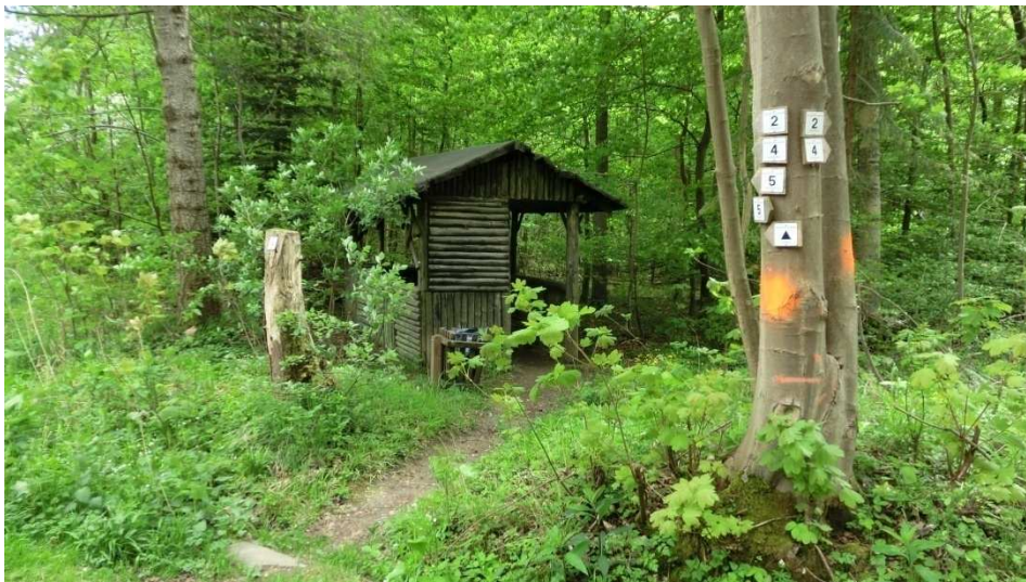
Schutzhütte am Bärensohl