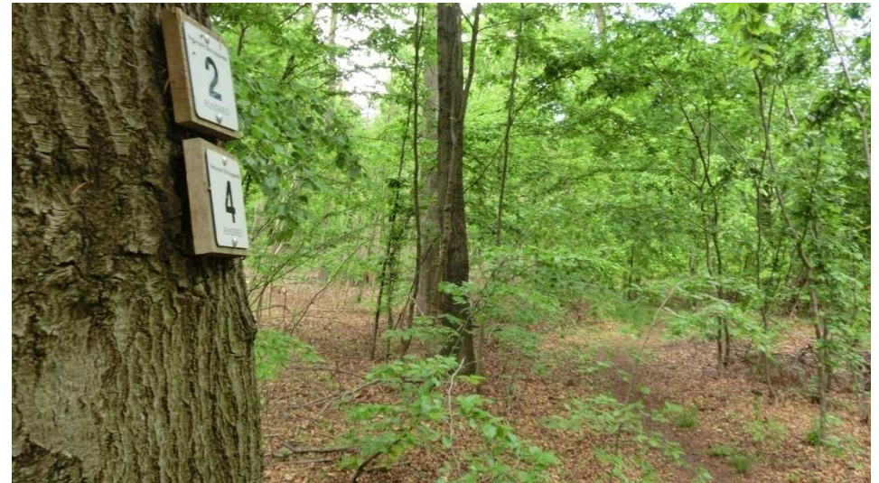
Zurück zum Parkplatz