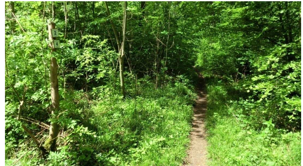
Auf dem Pfad zurück zum Ausgangspunkt