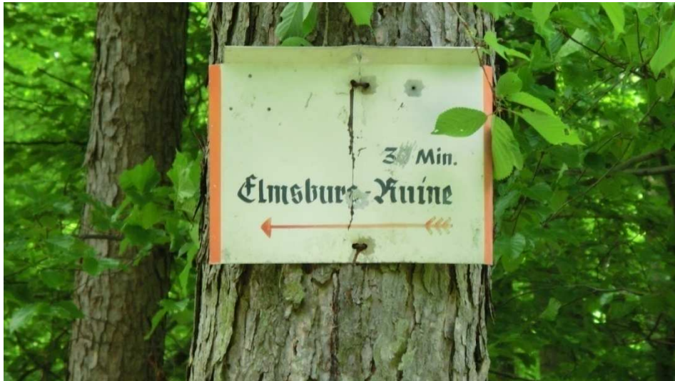
Alter Wegweiser zur Elmsburg