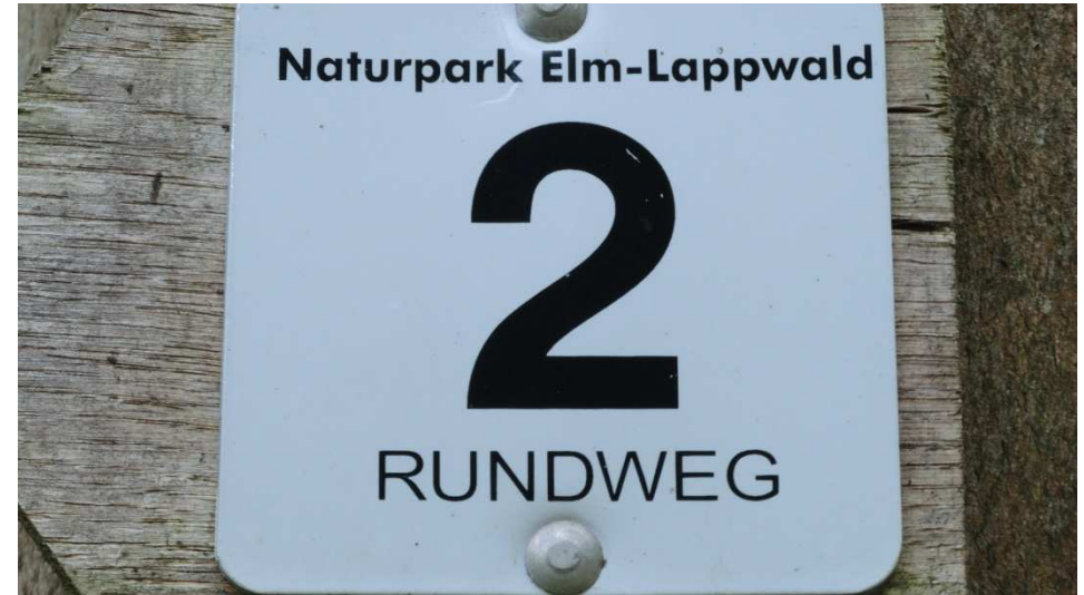
Auf dem Rundwanderweg 2