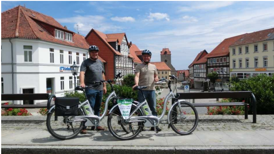
Start ist auf dem Burgplatz in Schönningen