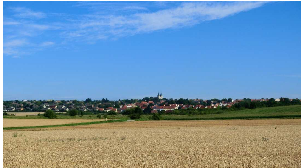
Zurück nach Schönningen