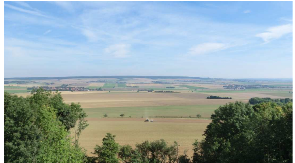
Blick vom Heeseberg-Turm zum Elm