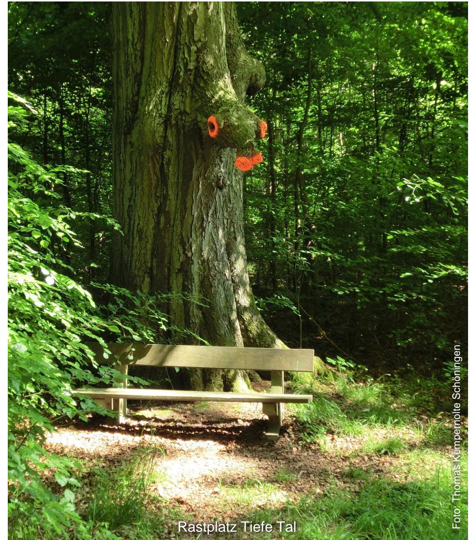
Rastplatz Tiefe Tal