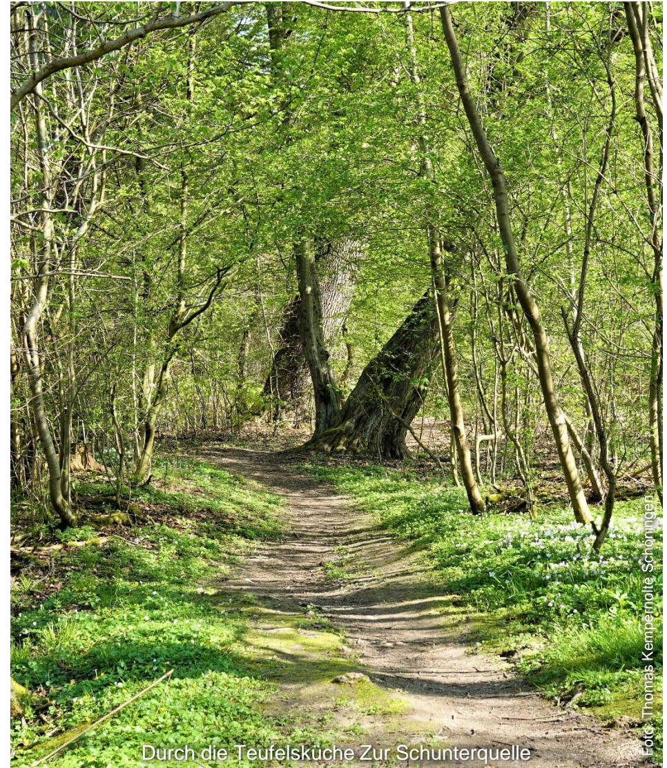
Durch die Teufelsküche Zur Schunterquelle