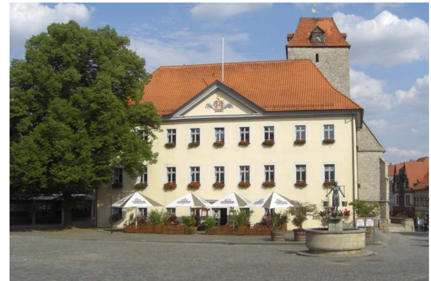
Marktplatz mit Wassermaid und altem Rathaus