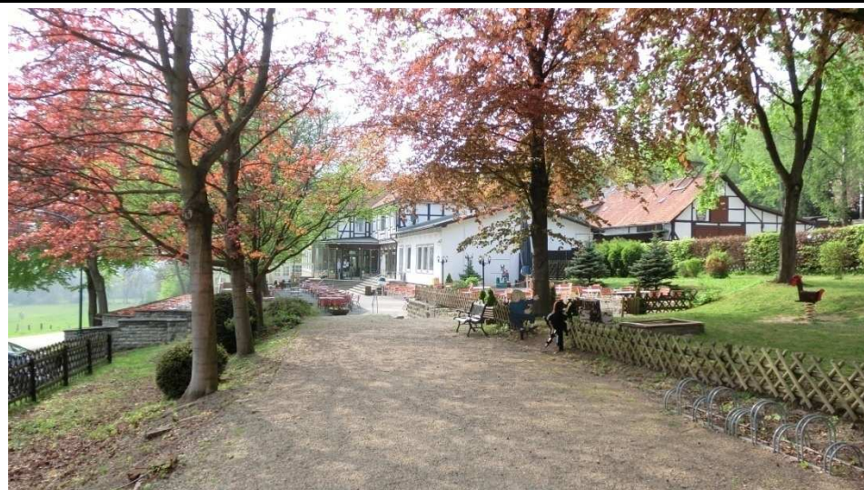
Am Ausflugslokal im Reitling