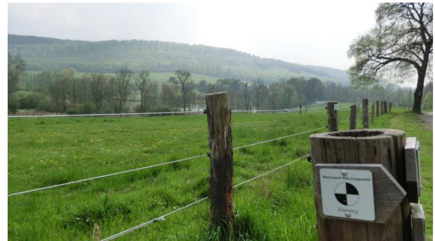
Auf dem Zielweg im Reitlingstal

Vom Waldrand aus hat man bei gutem Wetter einen herrlichen Blick auf Braunschweig.