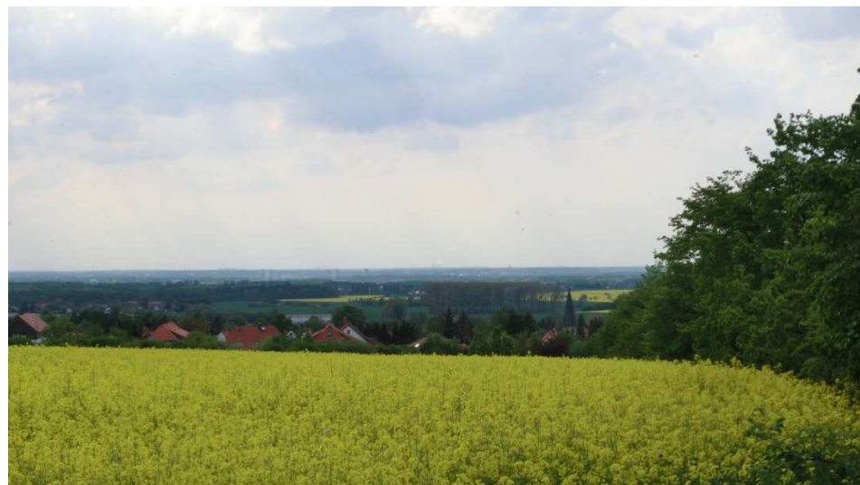
Blick auf Destedt