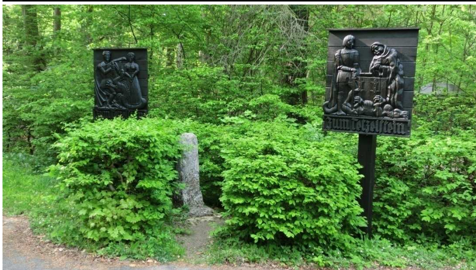
Start der Wanderung ist am Tetzelsstein