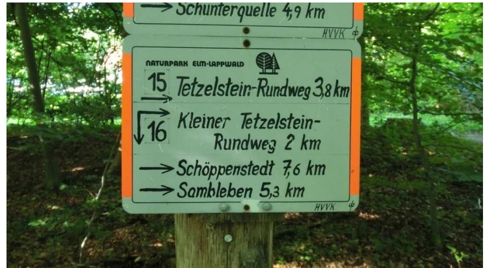
An der Gabelung folgt man bergab dem RW16