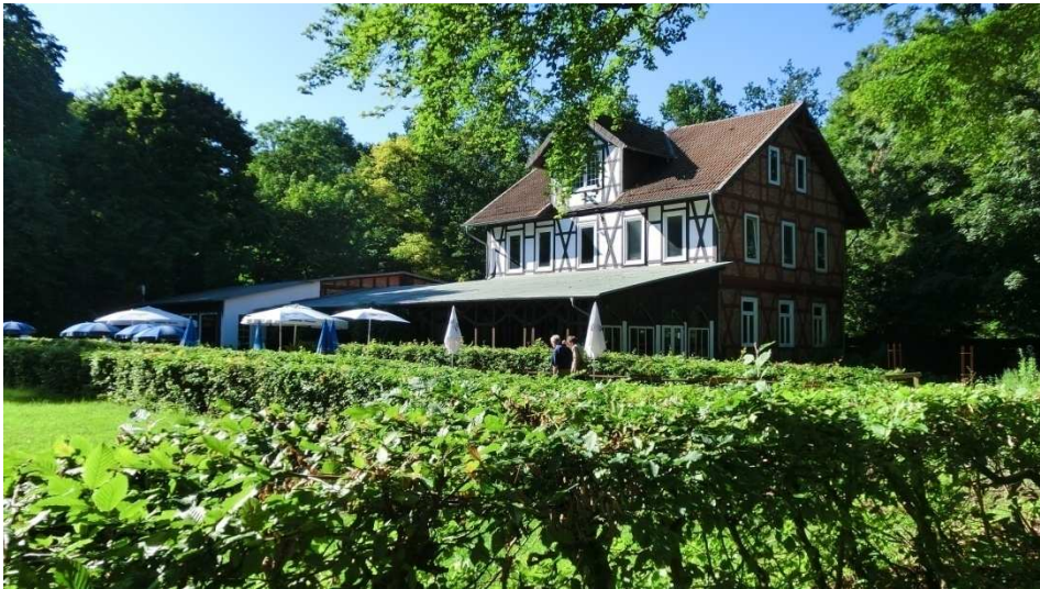
Das Gasthaus am Tetzelsstein